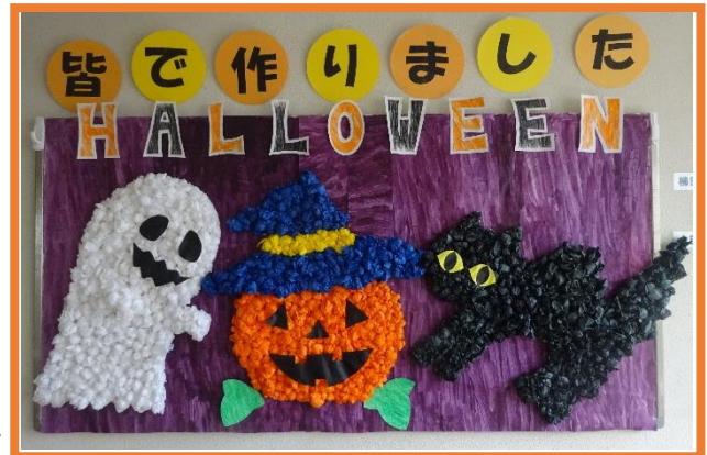
【利用者様と作成した今月の作品です】